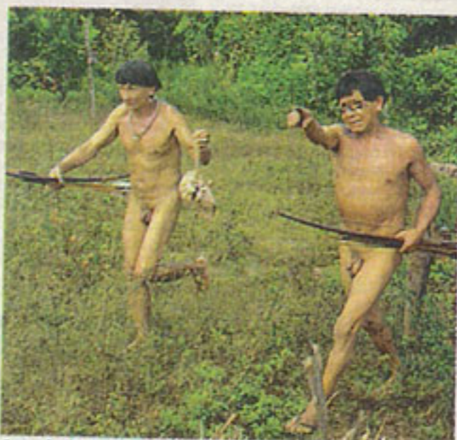
Cena de "Meu Primeiro Contato", de Mari Corrêa e Kumarê Txicão, que integra a mostra

O conjunto mais fulgurante do festival, no entanto, será a retrospectiva dedicada à obra documental do polonês Krzysztof Kieslowski